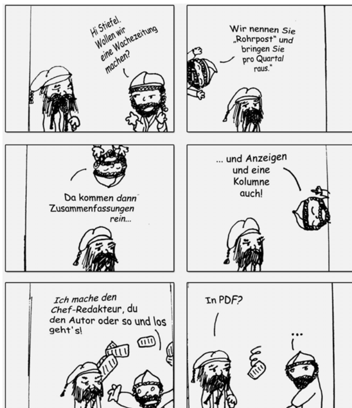
Wie die Rohrpost entstand...